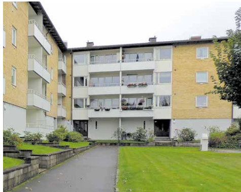
Distansgatan och Tuppfjätsgatan i Högsbo.

I somras stod det klart – vi utökar beståndet i Högsbo med närmare 200 lägenheter fördelade på tre hus. Samtidigt har husen på Astronomgatan och Keplers gata fått en annan ägare.