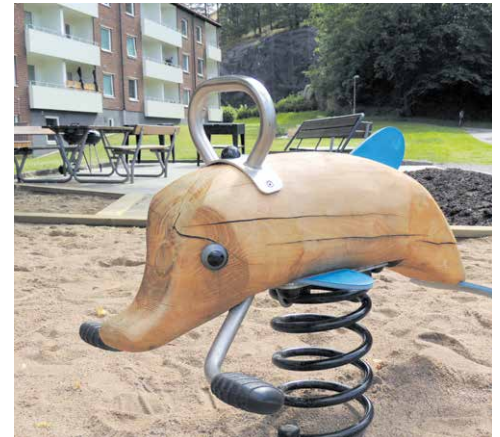
Här kan du rida på en delfin!

Lite arbete kvarstår till efter semestern, men på det stora hela är renoveringen på Solvarvsgatan och Nymånegatan färdig, både invändigt och utvändigt.