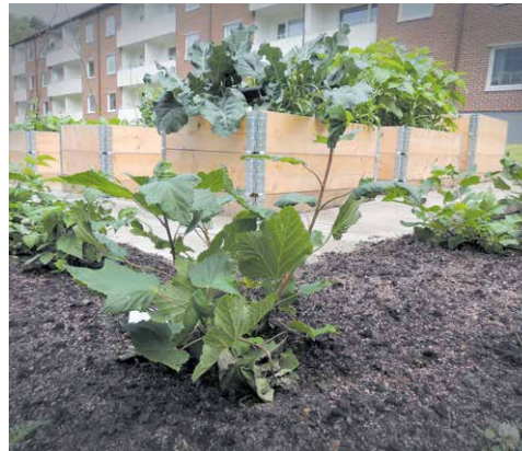
Odlingslådorna sköts av de boende själva. Här ska även planteras fruktträd.