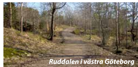
Ruddalen i västra Göteborg

Från Astronomgatan och Keplers gata är det bara ett stenkast till Göteborgs kanske mest dramatiska natur. Här finns bland annat klippor för bergsklättring, fornlämningar och